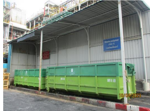
พื้นที่จัดเก็บของเสียอันตราย