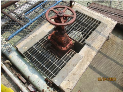
รูปที่ 5 บ่อน้ำเสียจากการดับเพลิง