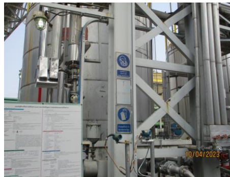
รูปที่ 26 ป้ายสัญลักษณ์เตือนอันตราย และป้ายเตือนด้านความปลอดภัย