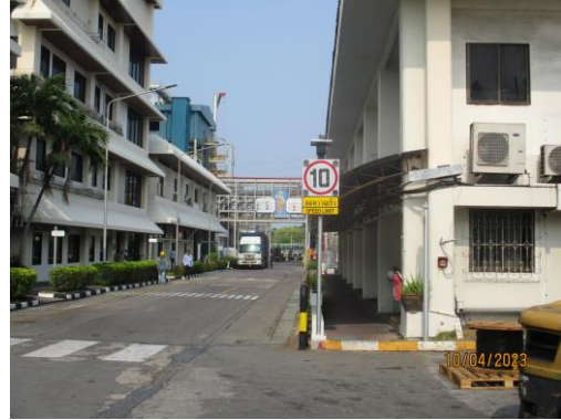
รูปที่ 16 เครื่องหมายด้านจราจร