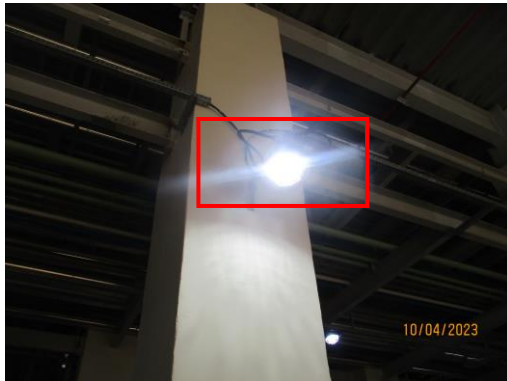
รูปที่ 17 แสงสว่างบริเวณขนถ่ายผลิตภัณฑ์