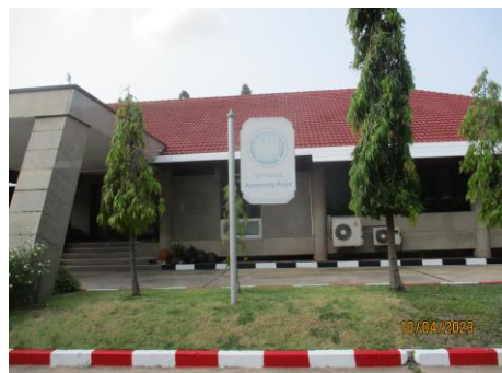
รูปที่ 39 พื้นที่สีเขียว