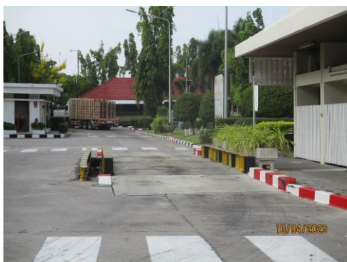
รูปที่ 19 พื้นที่ซังน้ำหนัก