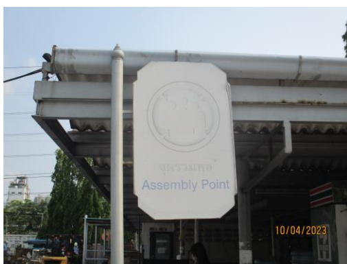
รูปที่ 37 จุดรวมพล