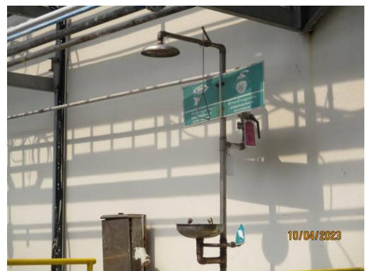
รูปที่ 36 อ่างล้างตาฉุกเฉิน