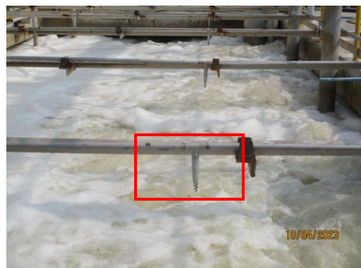
รูปที่ 9 หัวสเปรย์น้ำ