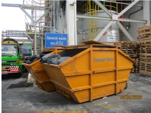
พื้นที่จัดเก็บมูลฝอยทั่วไป