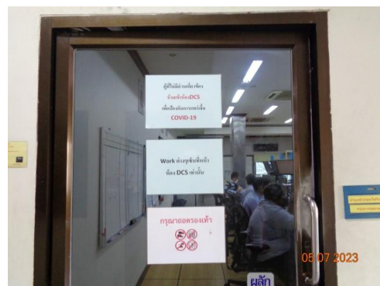
รูปที่ 31 ระบบ DCS