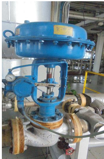
High Pressure Control Valve