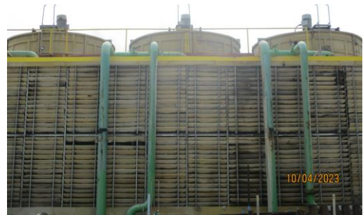
รูปที่ 35 Cooling Tower