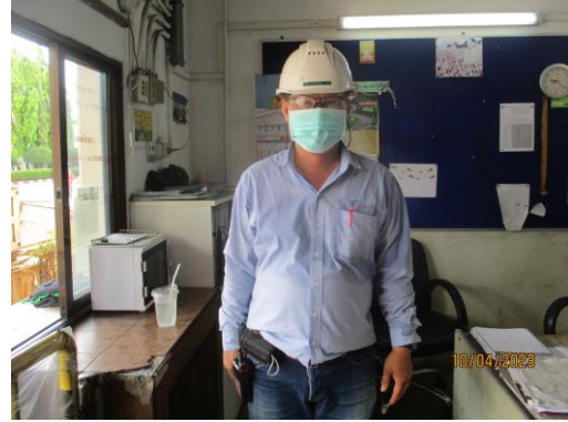
รูปที่ 27 พนักงานสวมใส่อุปกรณ์คุ้มครองความปลอดภัยส่วนบุคคล