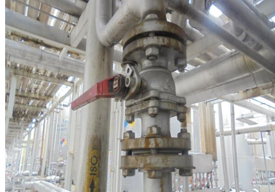
Shut off Valve