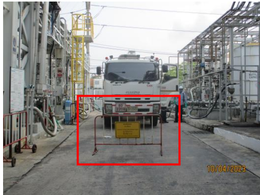
รูปที่ 18 ป้ายแสดงขอบเขตการขนถ่าย