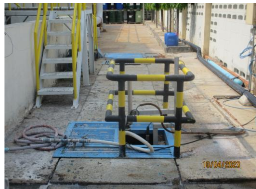
รูปที่ 8 Last tank