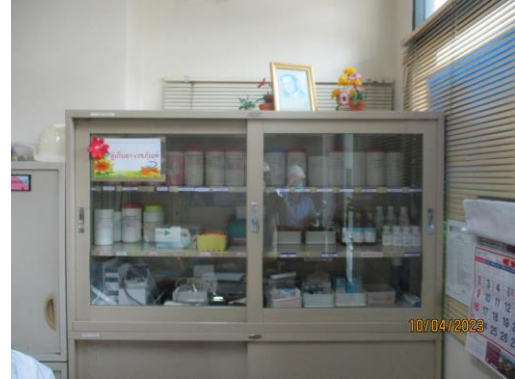
รูปที่ 29 สถานพยาบาลเบื้องต้น