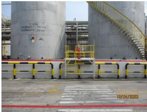
รูปที่ 34 Dike Wall/Dyke Wall