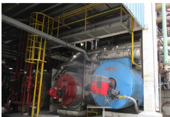
รูปที่ 2 หน่วยผลิตน้ำร้อน (HM Heater)