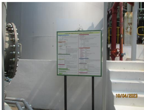
รูปที่ 28 SDS บริเวณพื้นที่ปฏิบัติงาน