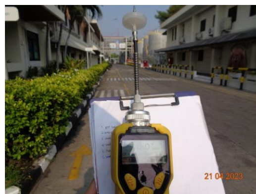
รูปที่ 3 เครื่องวัด VOCs