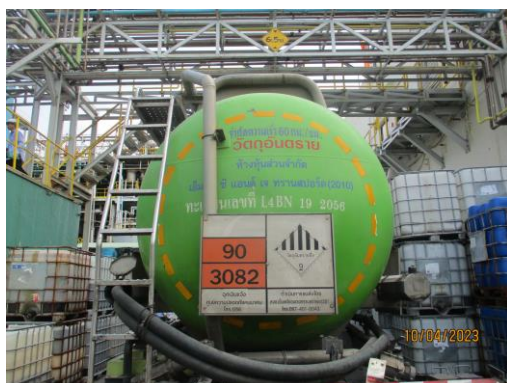
รูปที่ 20 ป้ายแสดงข้อมูลสารเคมีที่รถขนส่ง