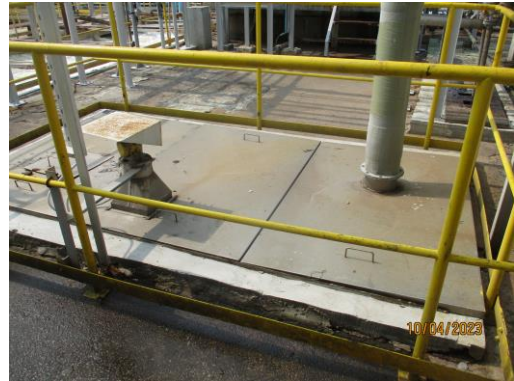
รูปที่ 6 Receiving Tank และฝาปิด