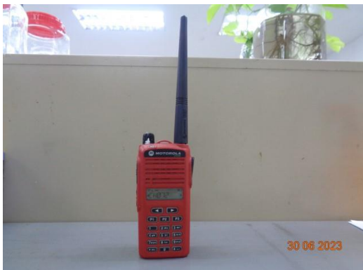
รูปที่ 38 วิทยุสื่อสาร