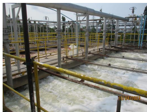
รูปที่ 4 ระบบบำบัดน้ำเสีย