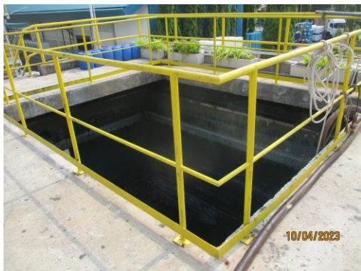
รูปที่ 7 Fish Pond