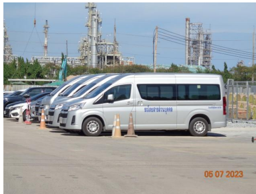
รูปที่ 30 รถสำรองฉุกเฉิน